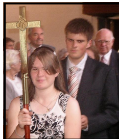
Prāvesta 20 gadu ordinācijas jubileja